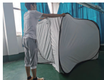
③ 正方形になるように、テントの形を整えます。 ※ねじれや歪みがある場合は手で直してください。