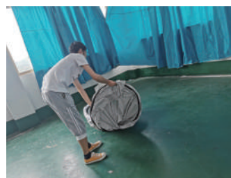
① 収納袋からテント本体を取り出します。