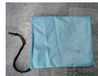
⑤ テントの四隅に袋を結びつけます。付属品の袋は必要に応じて使用してください。袋に水を入れた 500ml のペットボトル等を入れておもりにします。