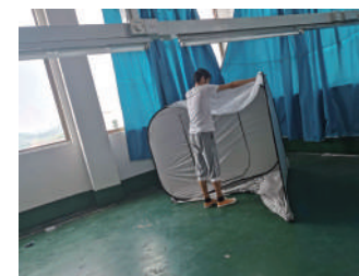
② 丸まっている状態から広げます。